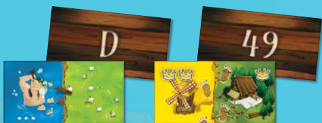
12 Dominosteine (A-F und 49-54)