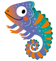
Illustration: Sandra Kretzmann Rédaction : Annemarie Wolke & Robin Eckert

Un jeu de course classique pour 2 à 4 explorateurs de la jungle à partir de 4 ans