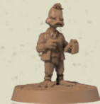
Howard the Duck