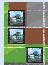
(Schwarz, mit weißen Spielsteinen)