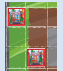
(Rot, ohne weiße Spielsteine)