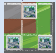
(Grau, mit weißen Spielsteinen)